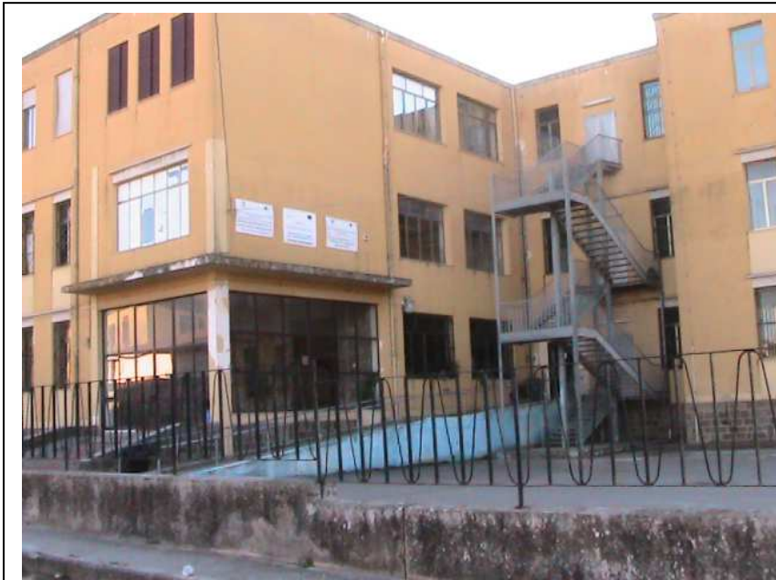
Istituto Professionale Industria e Artigianato

I dati delle tabelle dovranno essere sempre aggiornati e gli eventuali cambiamenti dovranno essere comunicati alle strutture del Sistema di Comando e Controllo.