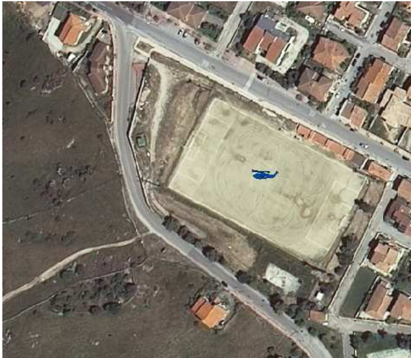
Campo sportivo San Pedru (foto aerea)

I dati delle tabelle dovranno essere sempre aggiornati e gli eventuali cambiamenti dovranno essere comunicati alle strutture del Sistema di Comando e Controllo.